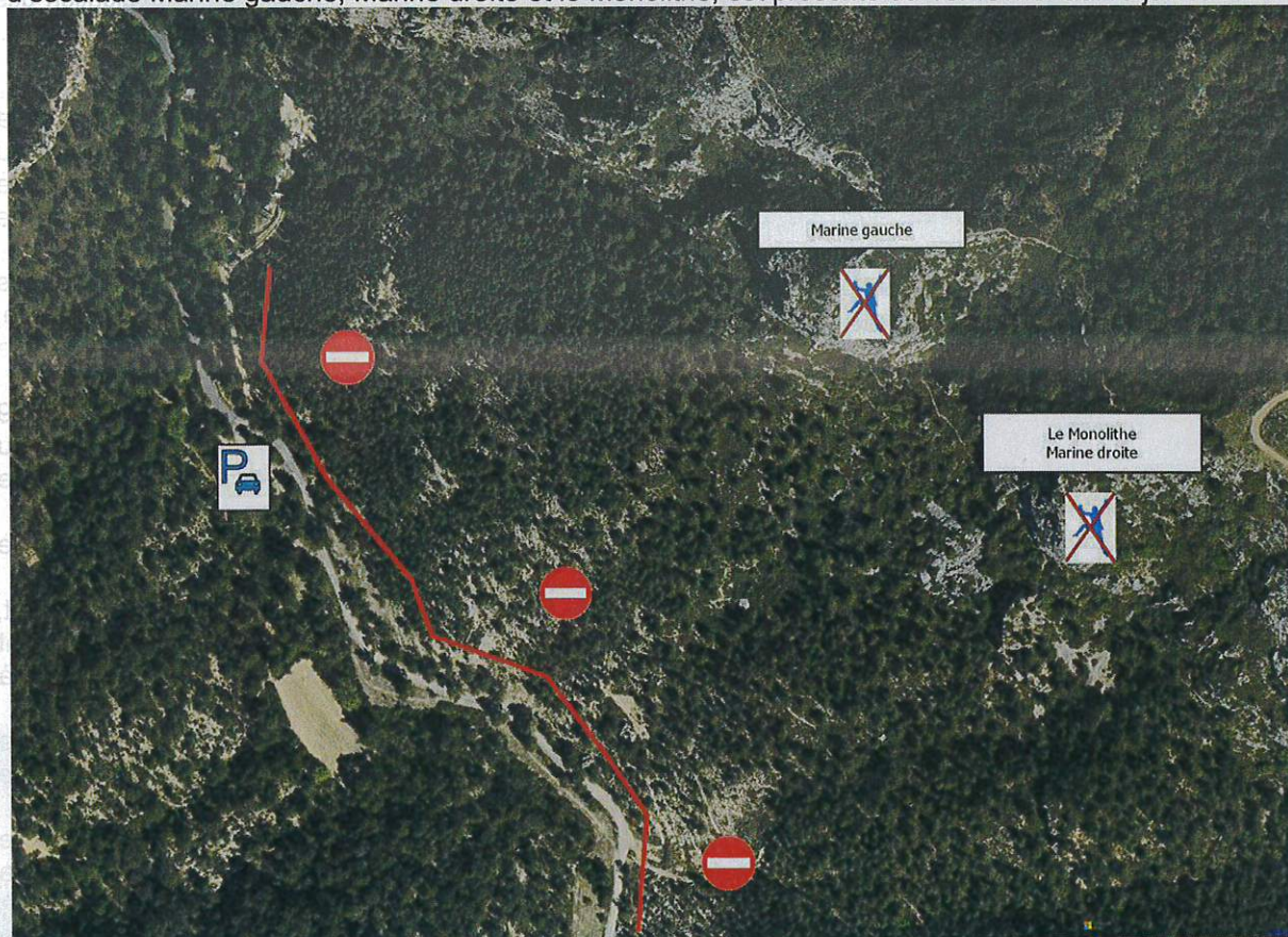
Figure 1 secteurs d'escalade et sentiers d'accès interdits du Pas de l'Étroit

Article 1 : Afin de garantir la quiétude nécessaire à la reproduction des espèces protégées réglementairement soit au niveau européen soit au niveau français, la fermeture des trois sites d'escalade Marine gauche, Marine droite et le Monolithe, est prescrite du 1er février au 15 juillet 2024.