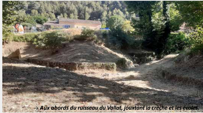
→ Aux abords du ruisseau du Vallat, jouxtant la crèche et les écoles.

Grâce à la convention avec l'Insertion emploi 13 (IE13) et la Métropole Aix-Marseille-Provence, la commune a encore bénéficié de travaux de débroussaillage (d'avril à juin), dans le cadre des chantiers d'insertion professionnelle. Cette opération a permis de sécuriser les différents cheminements piétons : le chemin de liaison partant de l'avenue Simone Garcin, au niveau de la maternelle, jusqu'au plateau sportif de la Plaine. Ces travaux ont également permis d'améliorer la protection contre les incendies de différents secteurs de la ceinture verte du village, notamment le ruisseau du Vallat jouxtant la crèche et les écoles, ainsi que la partie de forêt surplombant l'unité d'habitations de la Pourane. Ces travaux ont été financés à 100% par la Métropole. En 2023, la commune devrait bénéficier à nouveau de ces travaux.