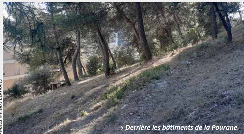
→ Derrière les bâtiments de la Pourane.