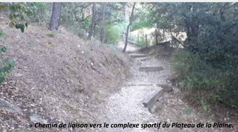
→ Chemin de liaison vers le complexe sportif du Plateau de la Plaine.