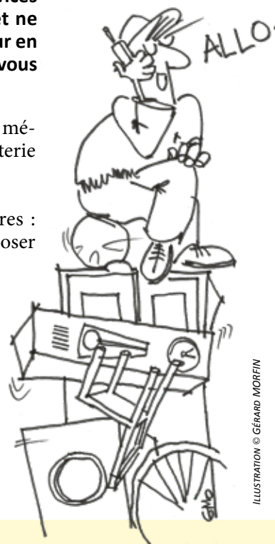
ILLUSTRATION © GÉRARD MORFIN

Le volume ramassé est limité à 2m 3 par passage (environ 4 machines à laver)