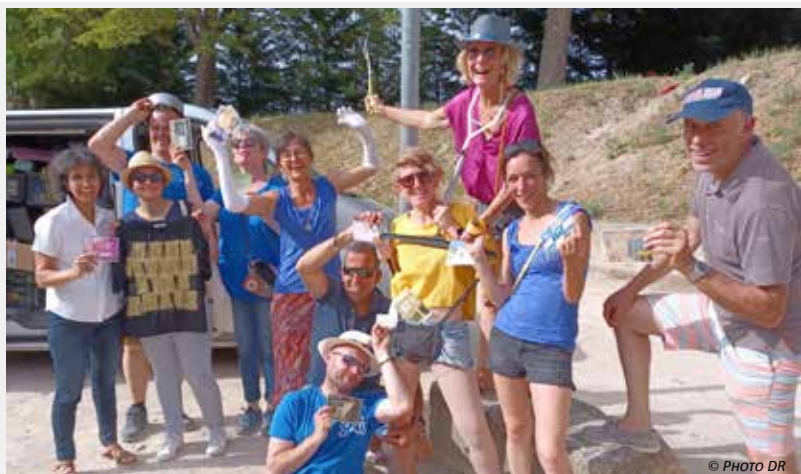
▲ Le public est venu nombreux pour profiter de la Gratiféria, proposée par Synthèse. Ce marché gratuit basé sur le principe d'échange a été l'occasion de dénicher des perles rares. Un grand bravo à l'équipe !