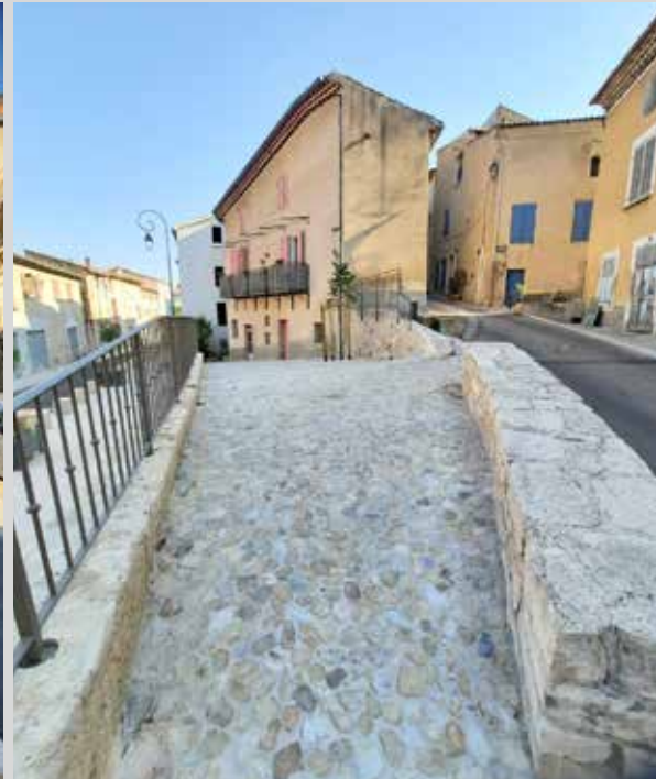
Une nouvelle avenue de la République P. 6