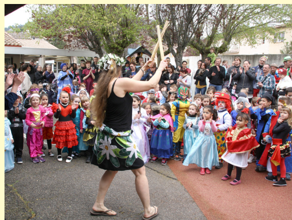
→ Dans la cour, les maternelles ont assisté à une démonstration de danse tahitienne avant d'aller défiler.

Avant d'aller défiler pour le carnaval, les maternelles ont profité d'une joyeuse démonstration de danse tahitienne. Ils ont ensuite assisté à un spectacle de magie interactif, offert par Meyrargues Animations. Un bon moment de détente durant lequel tout ce petit monde s'est bien amusé.