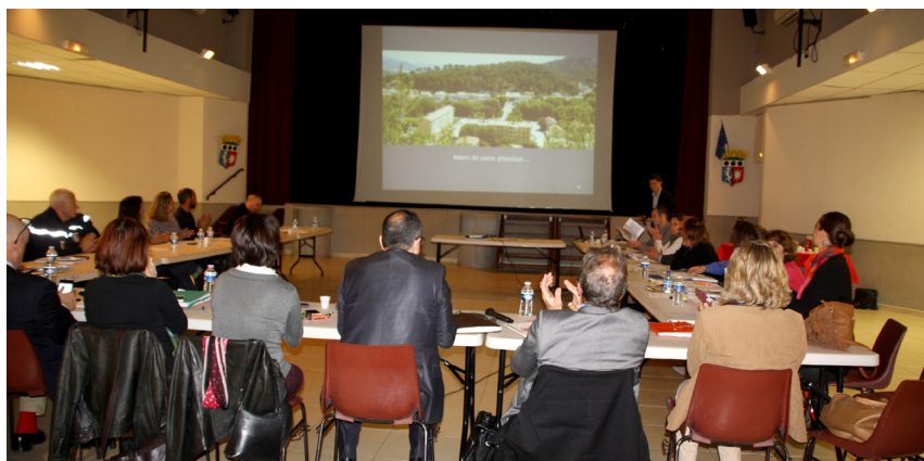
→ Le projet a été présenté aux personnes publiques associées le 29 avril dernier.

Une centaine de personnes a assisté à la réunion publique de présentation du futur zonage du Plan local d'urbanisme (Plu) le 25 mars dernier. Le public a ainsi pu obtenir des précisions sur la localisation exacte de certaines zones et sur les équipements prévus, notamment dans les quartiers ouest et du Moulin. Le 29 avril, la municipalité a présenté le projet de PLU aux personnes publiques associées (PPA), avant son arrêt en conseil municipal, le 16 juin.