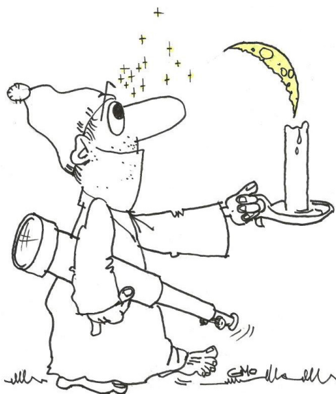
DESSIN GÉRARD MORFIN

Les participants auront certainement des étoiles plein les yeux cet été. La commission culture en collaboration avec l'association Astronomes amateurs aixois observatoire de Vauvenargues (AAAOV) organise une "Nuit des étoiles", le 27 août. Petits et grands sont donc invités au plateau de la Plaine, à partir de 20h30, pour profiter d'une observation à la fraîche. Dans un premier temps, un diaporama sera diffusé dans une salle du plateau, histoire de rappeler quelques leçons d'astrono-